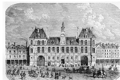
Hôtel de ville sous Henri IV

21/10/1680 Fondation de la Comédie Française 06/10/1773 Naissance à Paris du dernier roi de France Louis Philippe, fils du duc d'Orléans 05/10/1789 Louis XVI ramené à Paris (le boulanger; la boulangère et le petit mitron) 16/10/1793 La Reine Marie Antoinette est guillotinée.