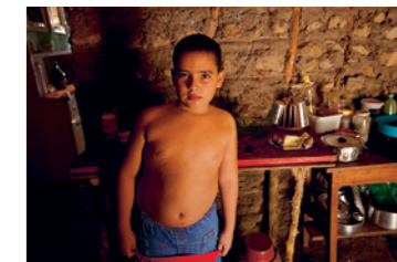
Muito além do peso

Du Brésil au Koweït, les taux d'obésité infantile sont anormalement élevés. Pourquoi les enfants sont-ils en surpoids aujourd'hui? L'industrie, les publicitaires, les instances publiques: qui est responsable de cette question de santé publique? Le film Muito além do peso tente de répondre à ces questions.