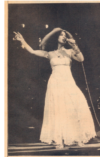
Noitada de Samba, Foco de Resistência

1971 : le Brésil est en pleine dictature militaire. A Rio de Janeiro, les compositeurs et les musiciens de la périphérie jouent pour la première fois dans la Zona Sul, tous les lundis, au 143 de la rue Siqueira Campos qui devient un feu de résistance de la musique populaire brésilienne.