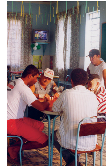
Os melhores anos de nossas vidas

À travers les témoignages de plusieurs malades ayant vécu des années dans une léproserie, la réalisatrice montre avec poésie et sensibilité les conditions auxquelles ils étaient soumis ainsi que les moments de vie partagés et les différentes dimensions de leur quotidien pendant ces années à l'hôpital.