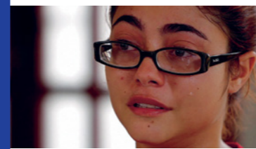
Silêncio das inocentes