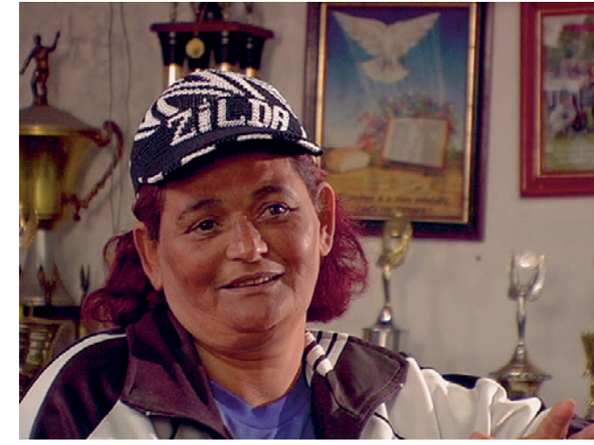
Vila das Torres