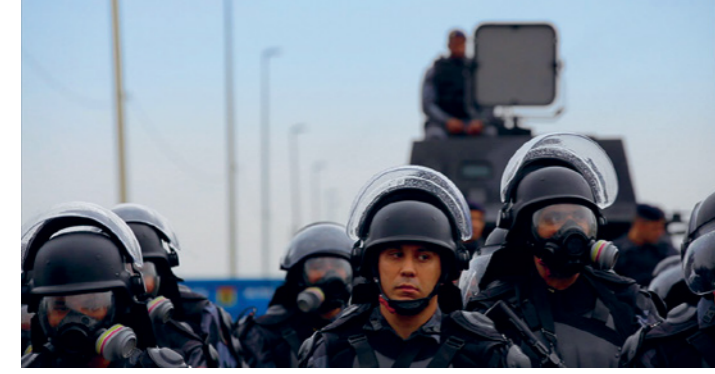
Jogos de poder