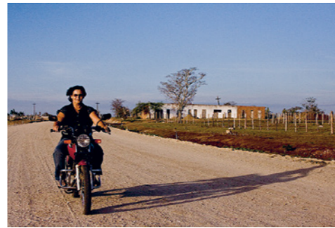
Virou o jogo: a história de Pintadas