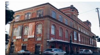
Em nome da segurança nacional

Ce documentaire évoque le procès du tribunal de Tiradentes , organisé par la Commission Justice et Paix de l'Archevêché de São Paulo en 1983. Il alterne entre scènes de la cour de justice et sources documentaires pour discuter de la doctrine de la «sécurité nationale», axe idéologique majeur de la dictature initiée par le coup d'État de 1964.