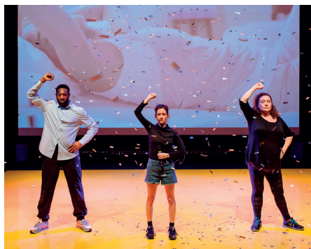
No World/FPLL

Trois performeurs et un conférencier dansent une présentation PowerPoint, miment une conférence TED ou déclament un discours de Steve Jobs vantant les mérites du progrès numérique. Retournant la réalité comme un gant de toilette mouillé, Winter Family propose un collage corrosif, tendant aux spectateurs et à eux-mêmes un miroir de la banalité de nos existence nourries de « shares », de « likes » et de « junk food », au chaud dans nos réseaux, refuges de nos indignations et du paternalisme culturel dont nous sommes tous ici les acteurs. Afin de réfléchir à une sortie de la cristallisation des classes inhérente au Non-Monde, Winter Family propose une tentative de libération : le FPLL.