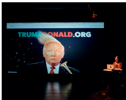
Astéroïde