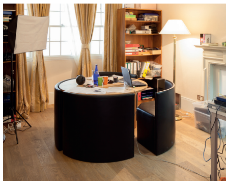
!Mediengruppe Bitnik

Suite à leur rencontre avec Assange, les artistes de !Mediengruppe Bitnik ont reconstruit de mémoire la pièce dans laquelle il vit depuis quatre ans. Ils invitent le public à pénétrer dans cet univers clos, à la fois prison et centre névralgique de WikiLeaks. Assange's Room est la manifestation physique des conflits qui ont surgi autour d'Internet et de la libre circulation de l'information. L'installation pointe la contradiction entre les murs de l'ambassade aux accès étroitement surveillés et les quelques mètres carrés depuis lesquels WikiLeaks continue de faire fuiter des documents secrets partout dans le monde.