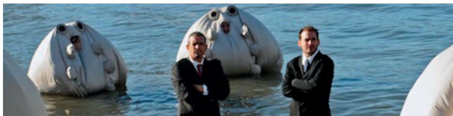
The Yes Men

Les Yes Men, activistes et rois du canular médiatique, pointent depuis vingt ans les dysfonctionnements du capitalisme mondialisé, de préférence en se faisant passer pour l'un de ses représentants. Tous les moyens sont bons pour opérer ces « corrections d'identités » : intrusion dans des événements, faux sites web, édition non autorisée du New York Times ou produits comme les Survival Balls (une combinaison bulle ridicule au prix exorbitant, qui devrait sauver les riches en cas de désastre climatique). Parmi ceux qui en ont fait les frais, George W Bush, l'OMC, Dow Chemicals (responsable de la catastrophe de Bhopal), Halliburton, McDonalds ou Exxon. Ferrailant contre la surexploitation des hommes et des ressources naturelles, ils continuent de lutter, joyeusement, pour un monde meilleur.