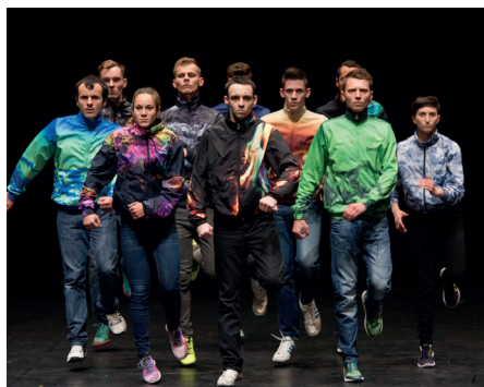
To Da Bone

Des performances de MrCovin, EDX, ToPa et Dubé sont programmées dans les espaces de la Gaité Lyrique le samedi 28 janvier de 17h à 21h et le dimanche 29 janvier de 14h à 18h.