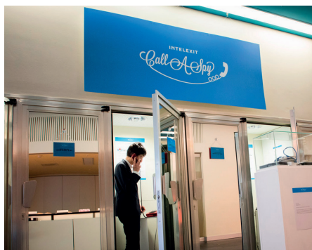
Collectif Peng!

Décrochez le combiné. Après quelques informations générales sur les agences de renseignement, choisissez le pays avec lequel vous souhaitez être mis en relation et discutez avec un agent du renseignement sans risque d'être identifié, chaque appel transite via un réseau virtuel privé qui masque la source originelle de l'appel.