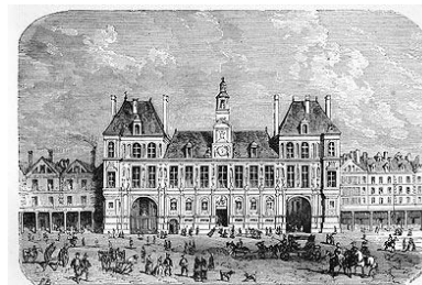
Hôtel de ville sous Henri IV

21.03.1884 Loi WALDECK- ROUSSEAU autorisant les syndicats professionnels