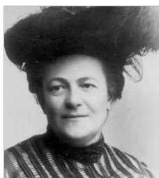
Clara ZETKIN 1857-1933

17.03.1904 Ouverture de la première Foire de Paris au Carreau du Temple et qui déménagera en 1925 au Parc des Expositions