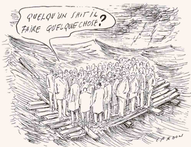
Crise : Banquiers et traders survivront-ils ?

PRESSE : Samantha Lavergnolle T : +33 1 73 73 82 21 / +33 6 75 85 43 39 E-M : lavergnolle2@gmail.com