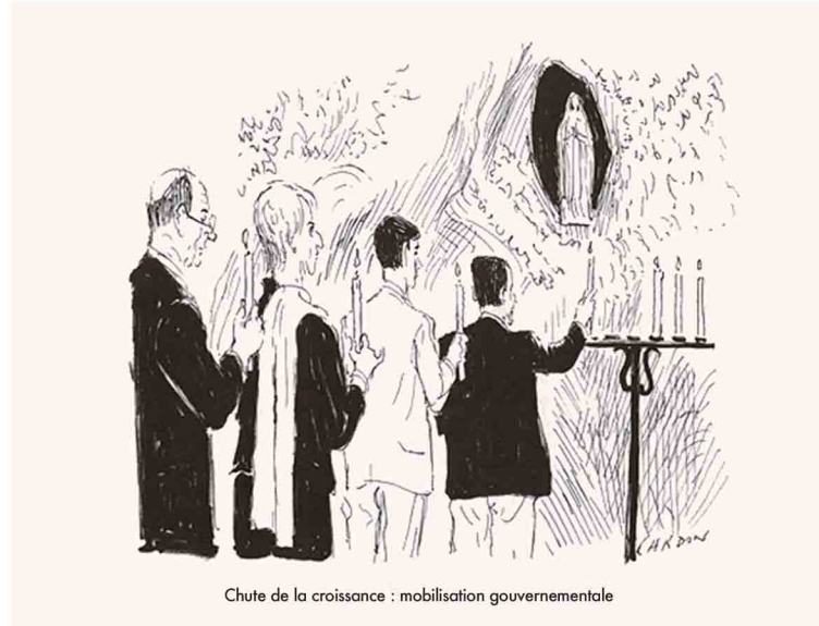
Chute de la croissance : mobilisation gouvernementale