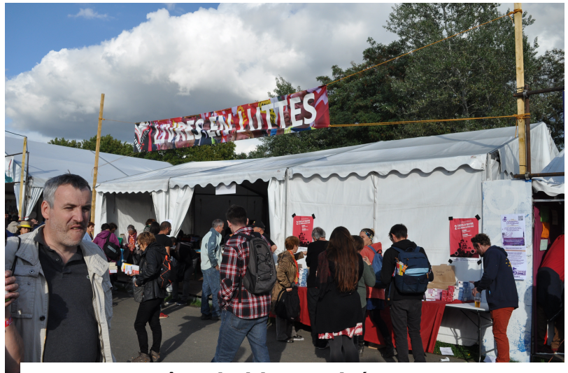
Fête de l'humanité 2018