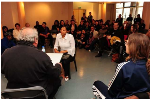
Présentation d'une saynète qui provoque alors le débat