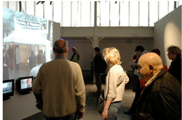
« Paroles et Mémoires des quartiers populaires », exposition de Canal Marches à la Maison des métallos, avril 2009