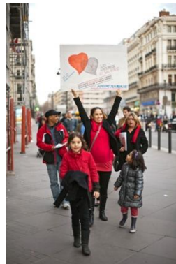
A Marseille en 2010, les amoureux défilent en famille !