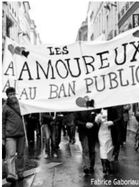
« 4 mariages et un enterrement », mobilisation sur le thème du respect de la liberté du mariage. (Paris/2008)