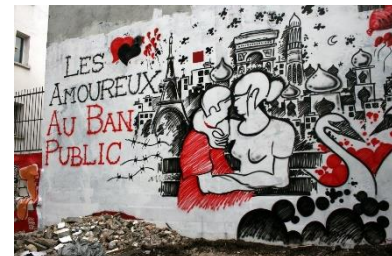
Graph réalisé dans le cadre d'une Balade urbaine sur le thème des couples franco-étrangers (Paris/2010)