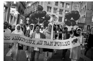
Les couples franco-étrangers déambulent en musique en direction de la mairie centrale de Lyon / 2008.