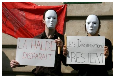
Happening devant les locaux du défenseur des droits pour réclamer le traitement des dossiers déposés à la Halde par les Amoureux au ban public (Paris / 2011)