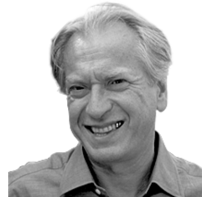
Bernard Friot : Le salariat : construction d'une classe révolutionnaire