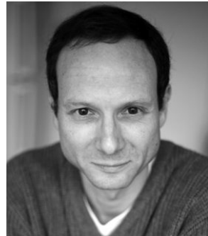
Frédéric Lordon : La révolution n'est pas un pique-nique. Analytique du dégrisement