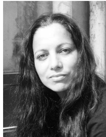
Houria Bouteldja : Pour une critique décoloniale du racisme