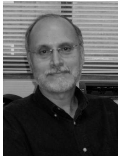
Gilbert Achcar : Bilan et perspectives du soulèvement arabe