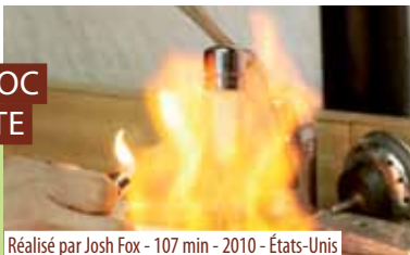
Réalisé par Josh Fox - 107 min - 2010 - États-Unis

Depuis quelques années, les États-Unis connaissent une nouvelle ruée vers... les gaz de schiste !