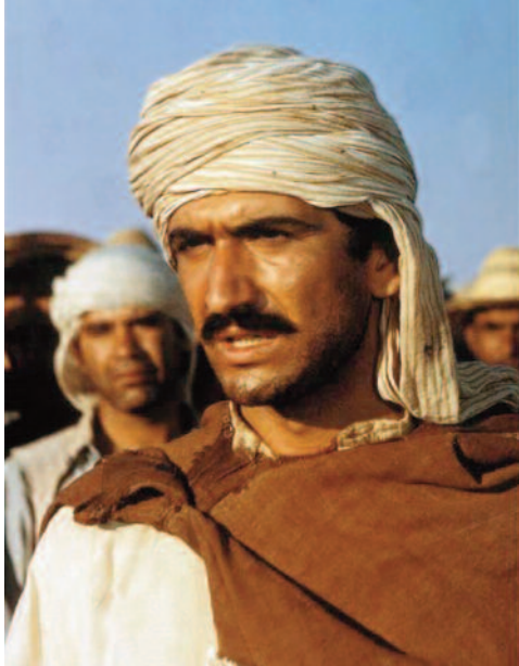
CHRONIQUE DES ANNÉES DE BRAISE