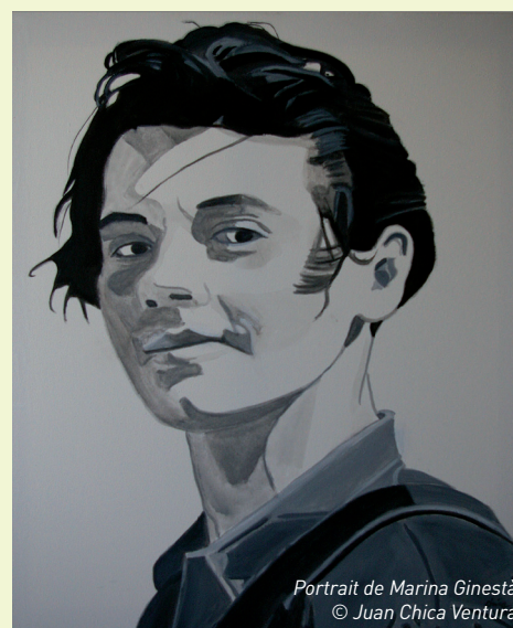
Portrait de Marina Ginestà

Plus que jamais, la mémoire des luttes anti-fascistes et pour la liberté occupe une véritable place au cœur de la cité. Plus que jamais, il nous faut connaître l'implication des étrangers dans l'histoire du combat pour la liberté dans le monde et savoir comment, malgré les écueils rencontrés, ils ont choisi de s'arrêter sur ce bout de terre et de contribuer à bâtir l'avenir, comme ils ont pu, avec, chevillé au corps, leur idéal de justice et de fraternité.