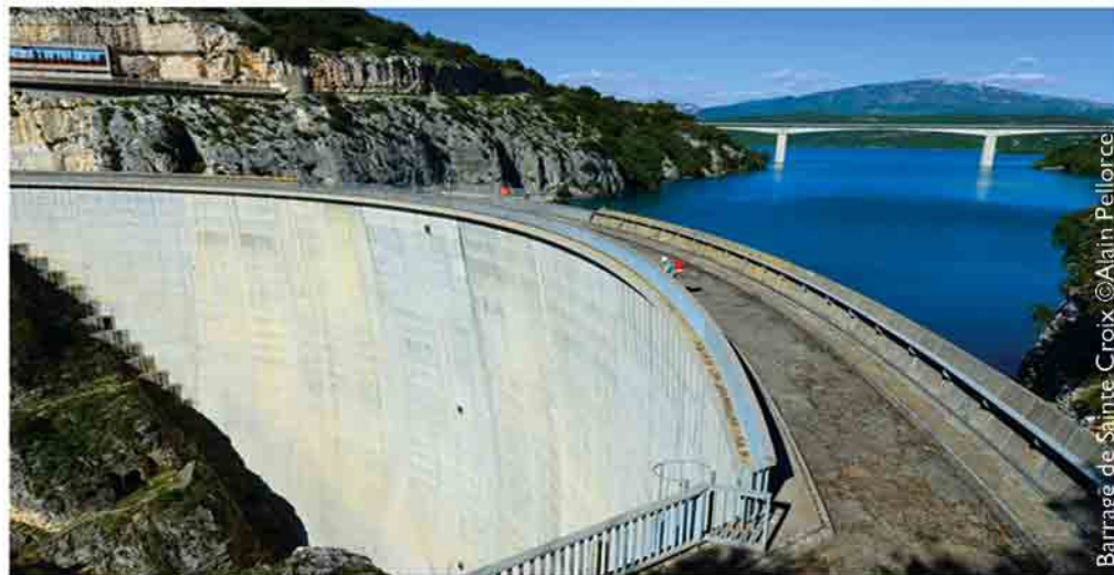
Barrage de Sainte-Croix