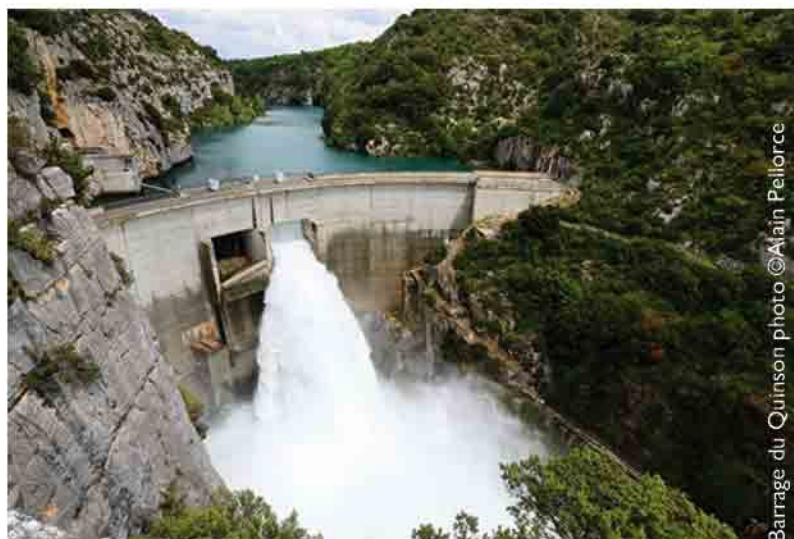
Barrage du Quinson

Le film donne la parole à des hydrologues, des prévisionnistes météo, des économistes, des historiens, des ingénieur.e.s et des élu.es, parmi lesquel.le.s :