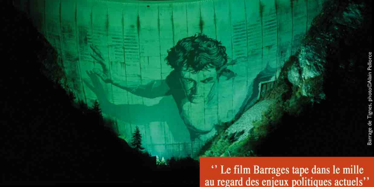
Barrage de Tignes, photo © Alain Pellorce

“ Le film Barrages tape dans le mille au regard des enjeux politiques actuels ”