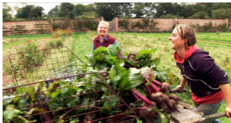
Coopérative dans la "Transition City Bristol"...