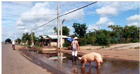
Animal domestique comestible à La Havane...

film documentaire, VOSTFR (en, dt, es, pt, it) 65 min.