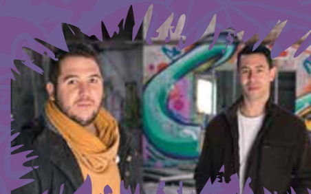
MAHOM (AFTRWRK / ODGProd.com / AFTRWRK)