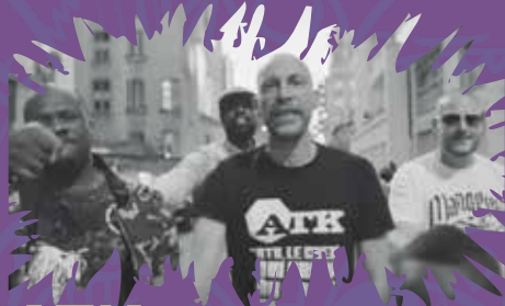
ATK