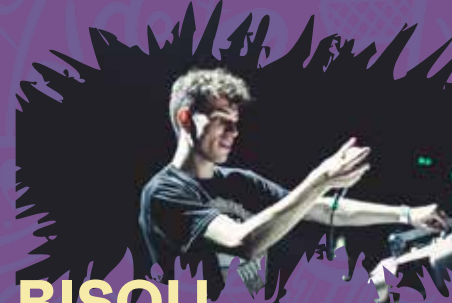
BISOU (AFTRWRK / ODGProd.com / AFTRWRK)

Bisou est le projet Electro Dub d'un jeune producteur montpelliérain. Signé par le fameux label ODGProd.com, il s'est surtout imposé sur scène où son son live, à l'image de ses productions, ne laissera personne indifférent. Il a notamment été à l'affiche du défunt Télérama Dub festival et de l'incontournable Reggae Sun Ska. Bisou fait mouche avec ses compositions bien ciselées, ses influences pop assumées et ses mélodies grisantes. Il n'hésite pas, chose rare dans le monde du rap, à s'aventurer dans le funk avec Rakoon, voire même dans la chanson avec Suzanne Léo.