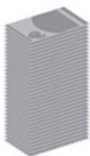
Retraite avec le système actuel 2 434 euros