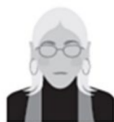
Sylvie Ouvrière dans le textile Fin de carrière en invalidité 58 ans