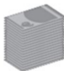
Retraite avec la réforme Macron 1 513 euros