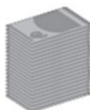
Retraite avec la réforme Macron 1 757 euros